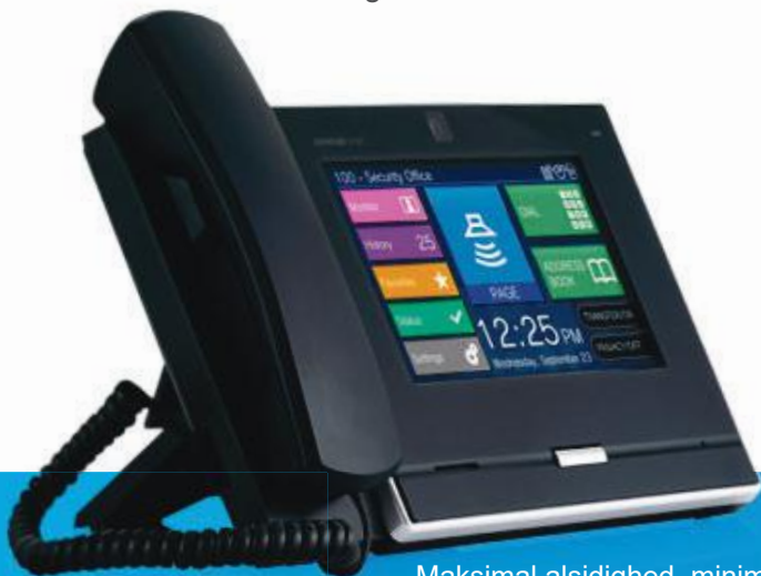
Maksimal alsidighed, minimal rod IX-MV7-HB | Hoved Station

Alt i den kvalitet og den stabilitet der forventes af et AIPHONE system.